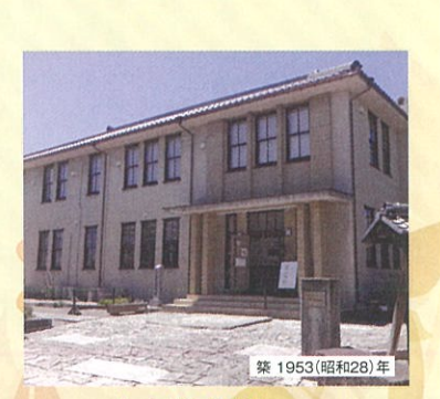
5. 市立資料館(郷土資料館)

近江兄弟社本社ビルの一部が資料館として公開されています。 ●入館料/無料 ●開館時間/9:00～17:00(月～金) ●休館日/土・日・祝 ●電話/☎0748-32-3131