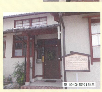
9. 近江八幡教会牧師館(旧近江兄弟社地塩寮)

大正期のヴォーリス建築の一つ。現在、NPO法人ヴォーリス建築保存再生運動「一粒の会」により保存、修復が行われ無料公開されています。 ●入館料/無料 ●開館時間/10:00～16:00 ●休館日/毎週火曜日・不定休あり ●電話/☎0748-33-6521