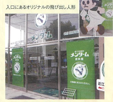
7. 近江兄弟社メンターム資料館

かつての近江兄弟社の独身青年社員寮です。地塩寮の名は「あなたがたは地の塩である」という聖書の言葉に由来します。現在は道路向かいの近江八幡教会の牧師館として使われています。 ●入館料/無料 ●開館時間/9:00～17:00(月～金) ●休館日/土・日・祝 ●電話/☎0748-32-3131