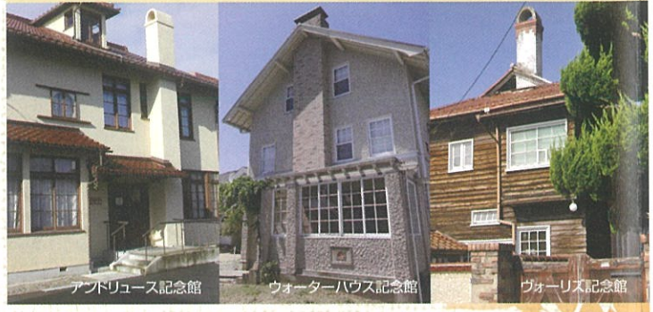
アンドリュース記念館 ウォーターハウス記念館 ヴォーリス記念館

※本事業は、公益社団法人びわこビジネスマンビューロー・公益財団法人近江兄弟社・近江八幡観光ボランティアガイド協会の協力により開催します。