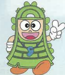
野洲市観光PRキャラクター ドウタクくん